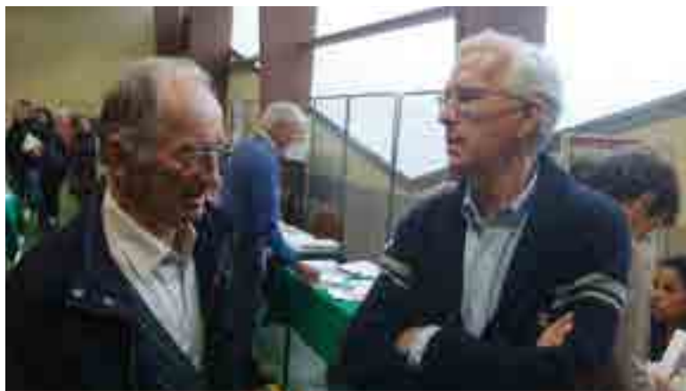
L'historien Raymond Ginouillac