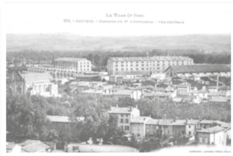
Caserne du 9 e régiment d'artillerie