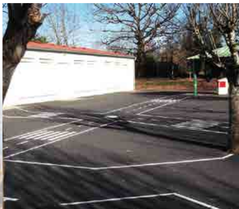
Réalisation des employés communaux sur la sécurité routière