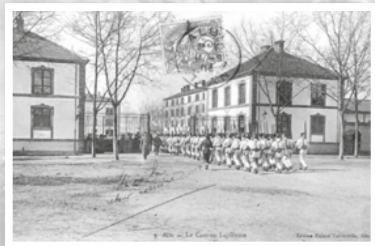
Caserne « Laperouse » du 15 e régiment d'infanterie d'Albi