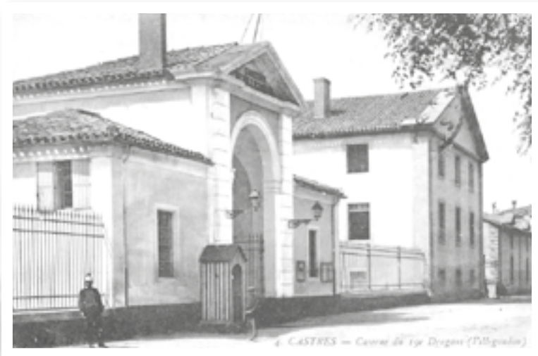
Caserne du 19 e régiment de Dragons de Castres