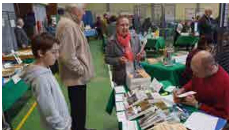
L'écrivain Alain Frisch