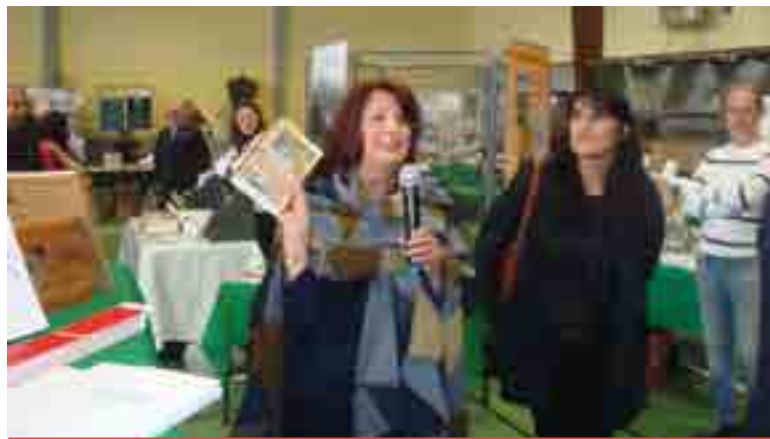
La romancière Muriel Batave-Matton